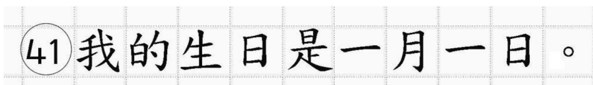
Рис.18. Образец написания иероглифических знаков

Бланк ответов № 2 (лист 1 и лист 2) по китайскому языку (рис. 16 и рис. 17) предназначен для записи ответов на задания с развернутым ответом по китайскому языку (строго в соответствии с требованиями инструкции к КИМ ЕГЭ и к отдельным заданиям КИМ ЕГЭ). Каждый иероглифический знак и каждый знак препинания следует писать внутри отдельной клетки в поле ответов бланка ответов № 2 (дополнительного бланка ответов № 2) (рис. 18).